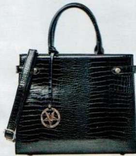
Primadonna Collection € 49,99