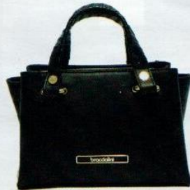
Graziella & Braccialini € 269