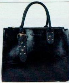
Valleverde € 85

DI EVELINA LA MAIDA - TESTO DI RACHELE DE CATA