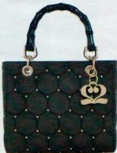
Numeroventidue € 120