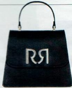
Rinascimento € 109