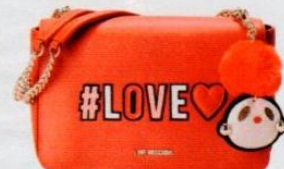
Love Moschino € 198