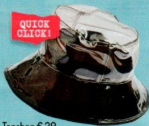
Topshop € 29