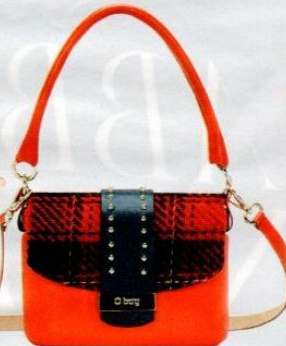
O bag € 101