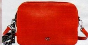
YNot? € 94,50