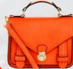
Accessorize € 29,90