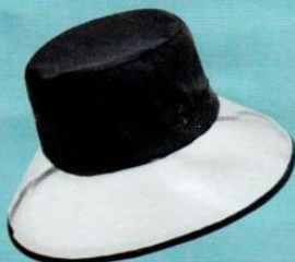
Ovs € 14,99