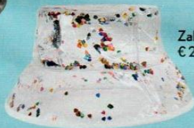
Zalando € 29,06

IN MATERIALE IMPERMEABILE, I BUCKET HAT COMPLETANO GLI OUTFIT AUTUNNALI. DI TENDENZA SULLA PASSERELLA DI CHANEL (E NON SOLO), IN STRADA FANNO COLPO I MODELLI VINILICI.