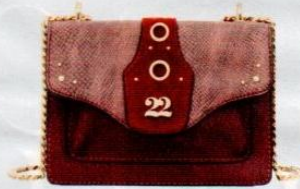
Numeroventidue € 114