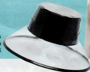
Eric Javits su modaoperandi.com € 233