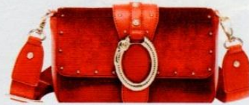
Liu Jo € 125