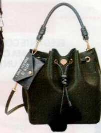
Le Pandorine € 79