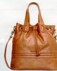
NeroGiardini € 149,50