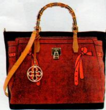
V°73 € 180