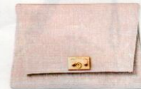
Rodo € 300