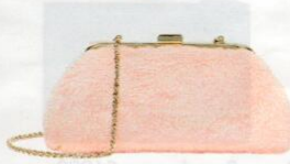
iBlues € 99