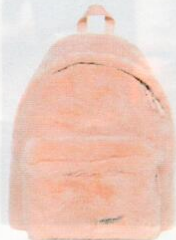
Eastpak € 90