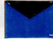
Dixie € 89