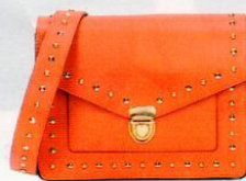
Kaos Accessories € 99