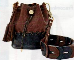
Il Bisonte € 375