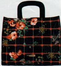
Particolari € 52,90