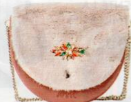
Ju'sto € 89,50