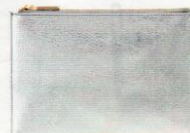
Whistles su zalando.it € 64,99