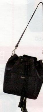
Dixie € 149