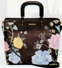
Fracomina € 91,90