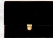
L'Atelier Du Sac € 59