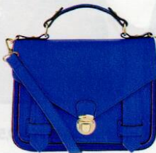
Accessorize € 29,90

ELEGANTE COME UNA MESSANGER DA AVVOCATO, COLORATA COME UNA BORSA DA STUDENTE, LA CARTELLA È UN MUST DAI MILLE VOLTI E DAI MILLE USI