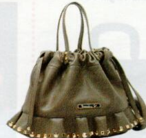
Braccialini Tua € 285