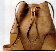
MICHAEL Michael Kors € 280