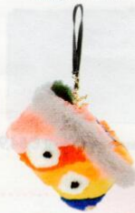
GUM Design € 125