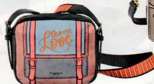
Tosca Blu € 109