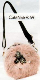
CaféNoir € 69

SONO FINTE MA SEMBRANO VERE E SE HAI VOGLIA DI GIOCARE UN PO', SONO SEMPRE DISPONIBILI: PROPRIO COME IL TUO ORSETTO DI PELUCHE