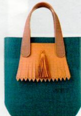
Ju'sto € 75,50