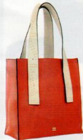
Numeroventidue € 120