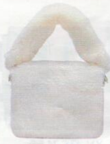
O bag € 83