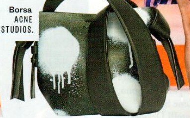
Borsa ACNE STUDIOS.