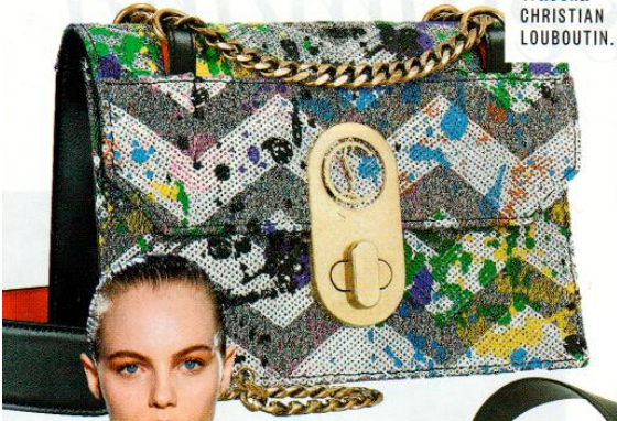
Tracolla CHRISTIAN LOUBOUTIN.